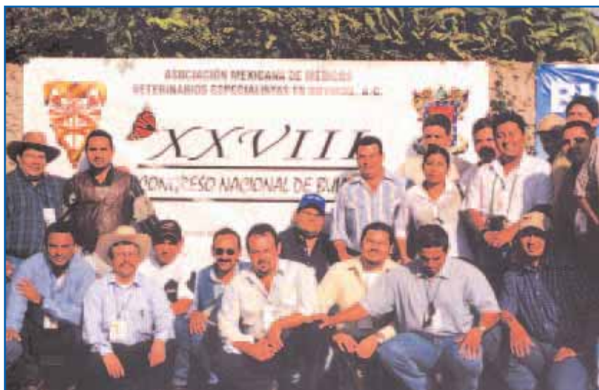
Participantes del XXVIII Congreso Nacional de Buiatría

El Congreso Nacional de Buiatría ha sido una autentica convivencia científica, los temas expuestos han sido de primer nivel,